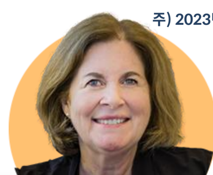
에스더 조지 캔자스시티

(6/3) 6, 7월에 50bp 금리 인상 지지. 인플레이션 후퇴하지 않으면 9월에도 같은 조치 취할 것. 인플레이션이 하향세에 있다는 강력한 증거 필요