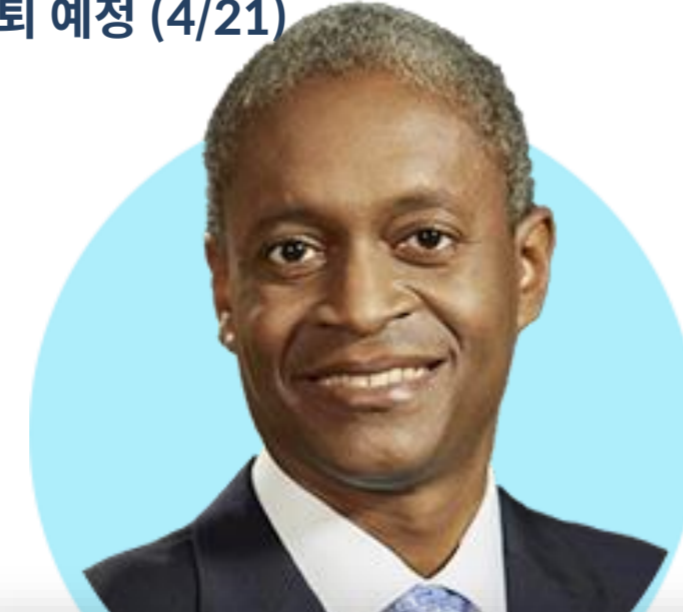
라파엘 보스틱 ★ 애틀랜타

(5/17) 연준이 중립금리 수준까지 금리를 올리면 인플레이션 억제 효과가 있을 것. 그 시기는 올해 말 정도로 예상. 2023년 미래 인플레이션 잘 대응할 것