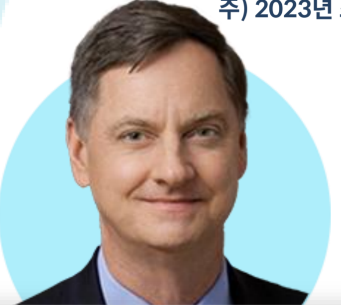
찰스 에반스 ★ 시카고

(5/20) 미국 가계 재정이 어떤 경우에는 팬데믹 이전보다 더 나은 상태이기 때문에 인플레이션 통제를 위해 더 금리 인상을 해야 할 수도. 연착륙은 불확실