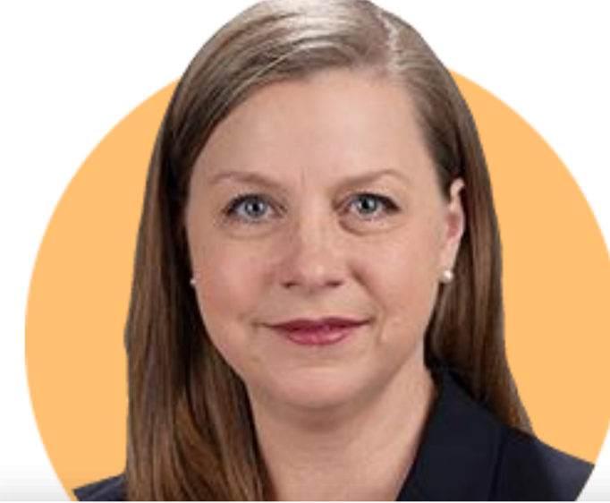
미셸 보우먼 이사

(5/30) 인플레이션이 진정될 때까지 매 회의에서 50bp 기준금리 인상을 지지. 연말까지 중립보다 높은 수준의 금리 유지하는 것을 지지