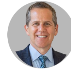
마이클 바/연준 부의장

(6/8) 상원 은행위원회에서 17-7로 바(Barr)를 연준 부의장 지지 통과. 상원 전체 인준에서 초당적 지지로 통과 될 것으로 보여. Barr 이사회에 합류할 경우 10년 만에 7인 체제가 되는 것