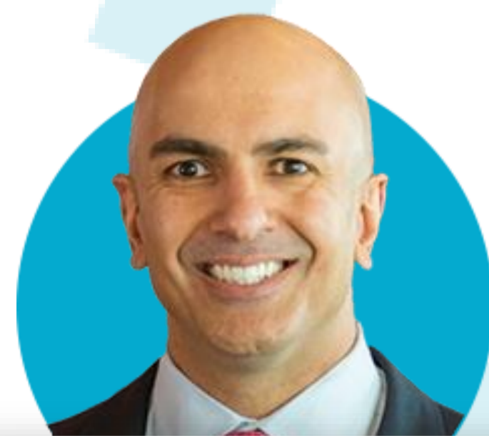
닐 카시카리 ★ 미니애폴리스

(5/20) 미국 가계 재정이 어떤 경우에는 팬데믹 이전보다 더 나은 상태이기 때문에 인플레이션 통제를 위해 더 금리 인상을 해야 할 수도. 연착륙은 불확실