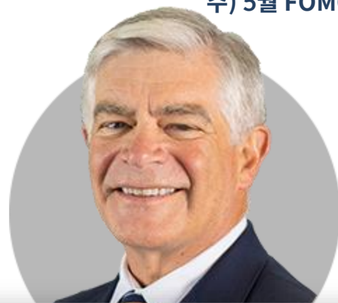
패트릭 하커 ★ 필라델피아

(6/1) 9월 금리인상을 '일시중지' 해야 한다는 제안을 Fed put으로 해석해서는 안돼. 정책 대응과 관련된 변화의 속도를 (시장) 이해하는 지 확인 위해