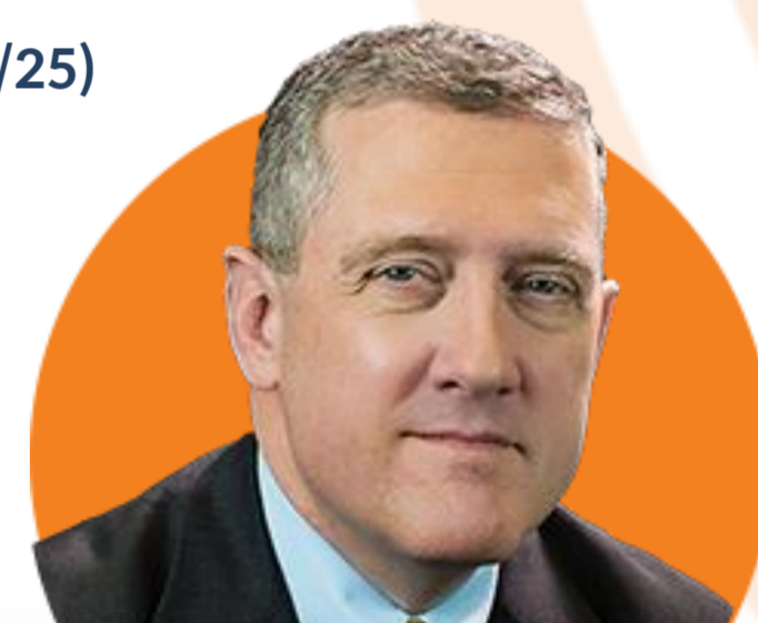
제임스 블러드 세인트루이스

(5/23) 인플레이션 완화가 최우선 목표. 연방기금금리가 8월까지 2% 도달할 것. 인플레이션이 분명히 감소하고 있다는 증거가 추가 긴축에 대한 판단이 될 것