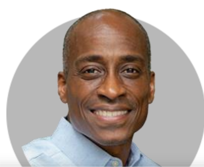
필립 제퍼슨 이사

(6/2) 6, 7월 FOMC 회의에서 50bp 금리 인상은 합리적 경로. 인플레이션을 목표치인 2%까지 낮추기 위해 해야 할 일 많아. 그 전까지 '일시중지' 없을 것