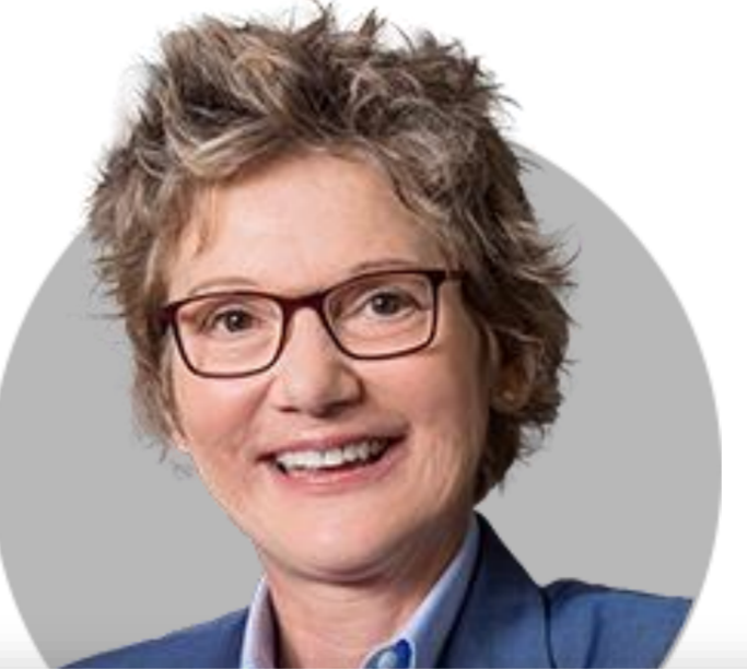
메리 델리 ★ 샌프란시스코

(6/1) 경기침체에 대한 어떠한 흔적도 찾을 수 없어. 사람들은 투자를 하고 소비자가 지출 한다는 것. 데이터나 경영진의 행동에서 경기침체의 흔적 못 찾아