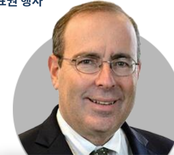
토마스 바킨 ★ 리치몬드

(5/18) 차기 두 번의 회의에서 50bp 인상 지지. 인플레이션이 연준의 목표를 향해 움직이고 있다는 확신이 들 때까지 연속적인 기준금리 인상할 것