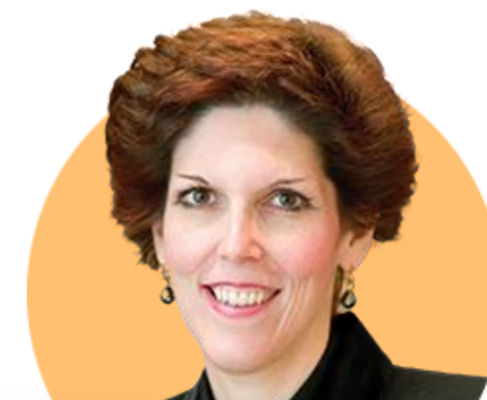
로레타 메스터 클리블랜드

(5/16) 첫 번째 작업은 인플레이션을 낮추는 것. 가장 집중하고 있는 위험은 인플레이션이 예상보다 높게 유지되면 어떻게 되는지. 지속적인 모니터링 필요