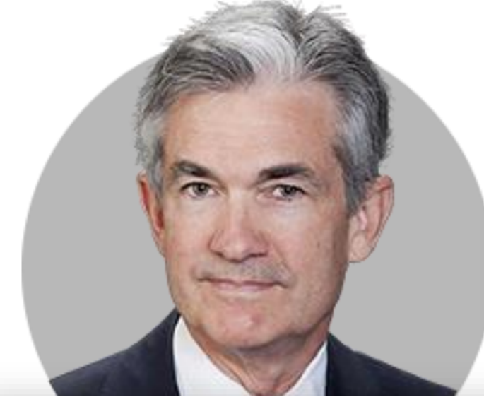
제롬 파월 의장

(5/11) 상원인준통과 91-7 네 번째 흑인 연준 이사 임기 2036년 1월 까지