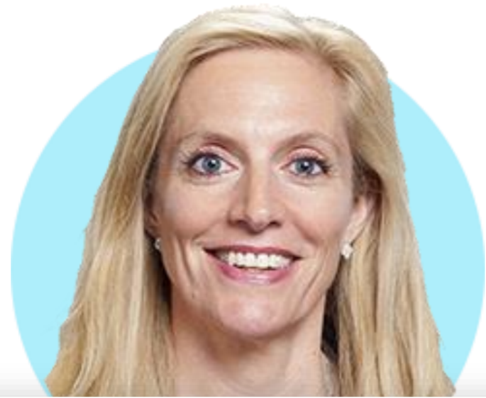
라엘 브레이너드 부의장

(5/10) 상원인준통과 51-50 흑인 여성 최초 연준 이사 임기 2024년 1월 까지