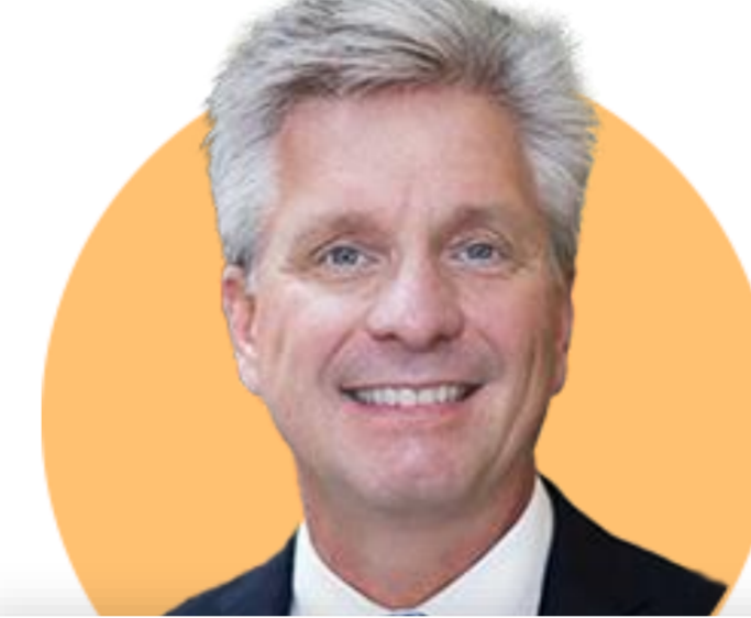
크리스토퍼 월러 이사

(6/15) 75bp 기준금리 인상은 상당히 이례적. 다음 회의에서는 50-75bp 인상이 가장 유력. 미국 경제 여전히 견고. 인플레이션 통제 위한 모든 노력 다할 것