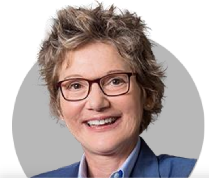
메리 델리 ★ 샌프란시스코

(5/24) 2% 인플레이션 달성에 실패하는 것은 경제에 더 큰 문제. 인플레이션 목표치에 도달하면 노동시장 스트레스 나타날 것으로 예상