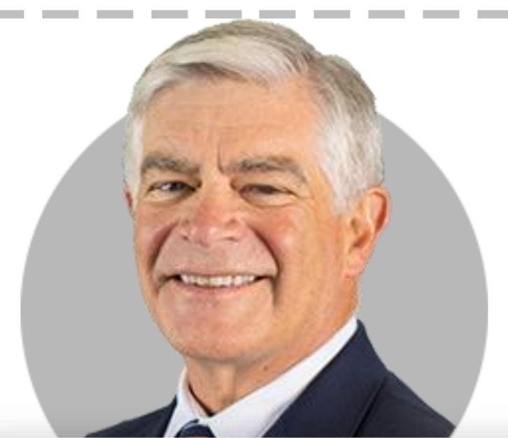
패트릭 하커 필라델피아

(5/28) 경기 침체 없이 인플레이션 낮출 수 있다고 생각. 인플레이션이 너무 높다는 것은 의심의 여지 없어. Fed의 조치는 경제를 통해 작동하는 꽤 시간 걸려