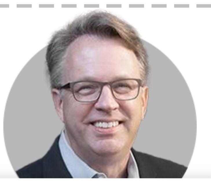
존 윌리엄스 뉴욕

(5/23) 은행이 필요할 때마다 연준 배스톱 사용할 수 있어야. 은행은 정기적으로 유동성 공급 테스트 통해 탄력적 시스템 만드는 것이 중요