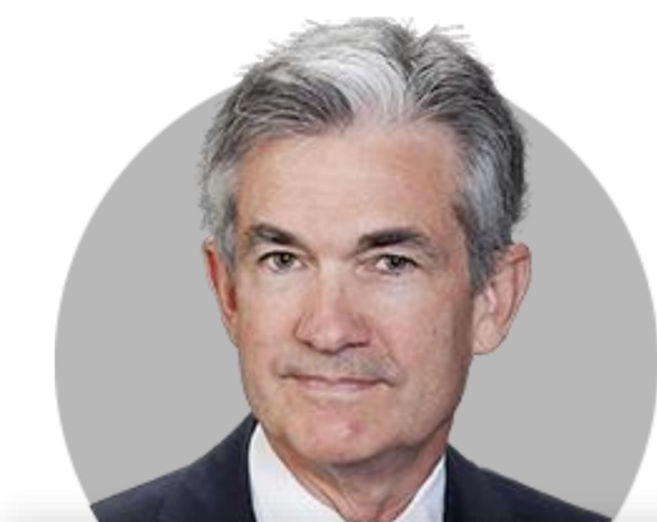
제롬 파월 의장

(5/31) 긴축 신용이 경제에 미치는 영향은 여전히 불확실. 6월 회의에서 금리 인상을 건너뛰고 추가 긴축 정도를 결정하기 전에 더 많은 데이터를 봐야