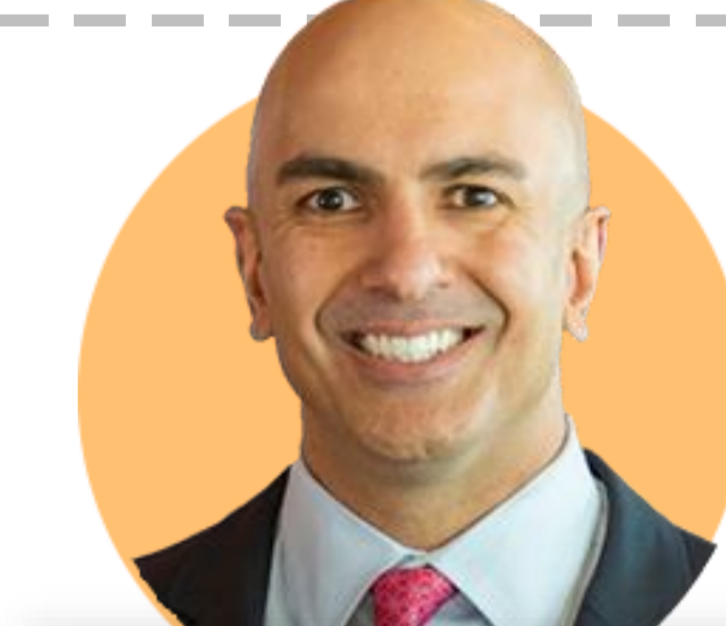
닐 카시카리 미니애폴리스

(5/16) 수요일과 금요일 재정조정 보이기 시작. 경제 올해 더 확장할 것으로 기대. 인플레이션 점진적으로 올바른 방향으로 움직여. 은행 상황 08년 은행위기와 달라