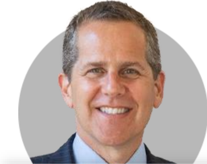
마이클 바 부의장

(4/21) 고용시장 강세지만 냉각 조짐 보여. 지속적인 경제 강세와 느린 디스인플레이션은 연준이 더 많은 일을 하도록 압박. 3월 PCE 4%대로 완화 예상