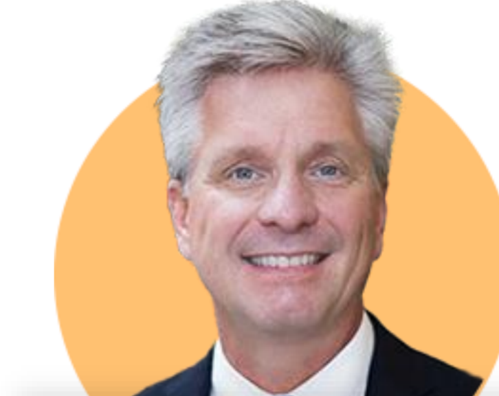
크리스토퍼 월러 이사

(6/14) 긴축정책의 완전한 효과 나타나고 있지 않지만, 시차를 고려한다면 '일시중지(pause)' 후 7월 FOMC 전 더 많은 데이터를 살펴보는 게 바람직