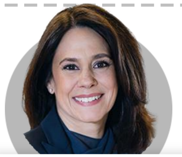
로리 K. 로건 델러스

(6/1) 은행 신용 긴축은 25bp 금리 인상과 같은 완만한 효과 낼 것. 올해 경기침체 예상하지 않아. 6월 회의에서 금리 인상 건너뛰고 상황 지켜볼 필요 있어