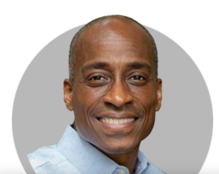
필립 제퍼슨 이사

(5/16) 자산 1천억 달러 이상인 은행의 실질손실 회계에 더 엄격한 기준 고려. 상업용 부동산 위험 주의 깊게 살피는 중. 지역은행 건전하고 탄력적