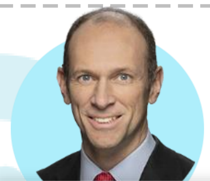
오스탄 굴스비 시카고

(5/31) 낮아진 임대료는 인플레이션 데이터에 반영되지만 주택 가격 자체는 평준화되고 있어. 부동산 반등은 인플레이션 완화 위한 연준의 싸움에 영향 줄 것