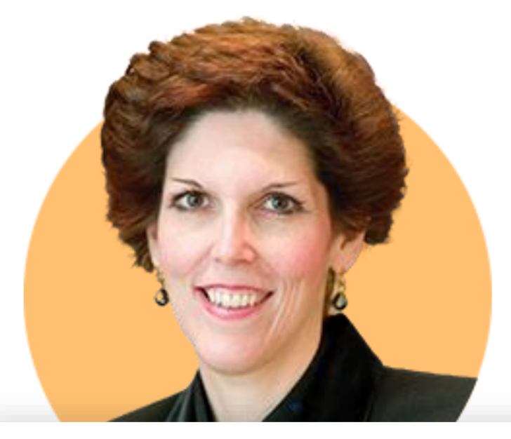
로레타 메스터 ★ 클리블랜드

(5/30) 향후 경기침체에 금리가 다시 '0'으로 떨어진다면 충격적일 것. Fed 정책 제한적인 영역에 있지만 금리를 어디로 가야 하는지에 대한 불확실성 있어