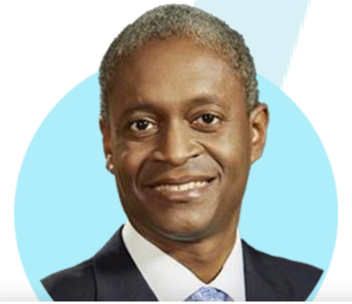
라파엘 보스틱 ★ 애틀랜타

(5/22) 서비스 인플레이션 상당히 확고. 금리인상이 끝났다고 말하고 싶지 않아. 은행 문제에 대해 모든 것을 명확하게 선언하기에는 너무 일러. 연준 인플레이션 계속 싸워야