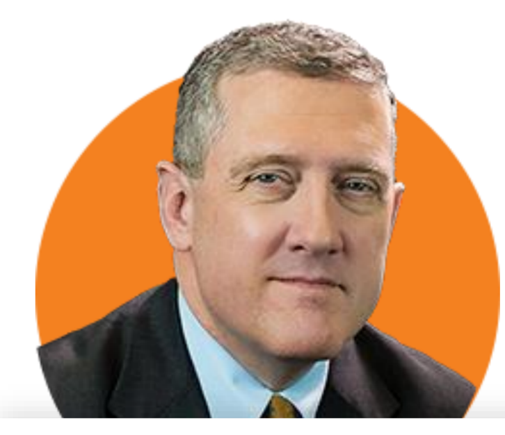
제임스 불러드 ★ 세인트루이스

(5/26) 오늘의 데이터는 Fed가 할 일이 더 많다는 것을 시사. 5% 이상의 기준금리 지지. 비주택 근원 서비스 물가 완고하게 남아. 좀 더 긴축해야 할 필요성 있어