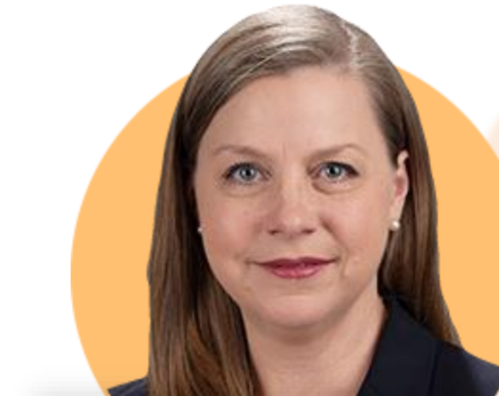
미셸 보우먼 이사

(5/24) 향후 3주간의 데이터에 따라 6월 금리인상 또는 동결 결정될 것. 평균 시간당 임금 3%에 근접하지 않는 한 인플레이션 많이 떨어지지 않을까 걱정