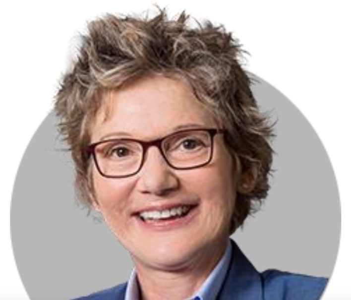
메리 델리 ★ 샌프란시스코

(8/4) 2024년까지 제한적인 영역에 있을 가능성 높아. 임금 상승률이 높다는 것에 놀라지 않아. 미국 고용 증가는 질서 있게 둔화되고 있으며 추가 인상 불필요