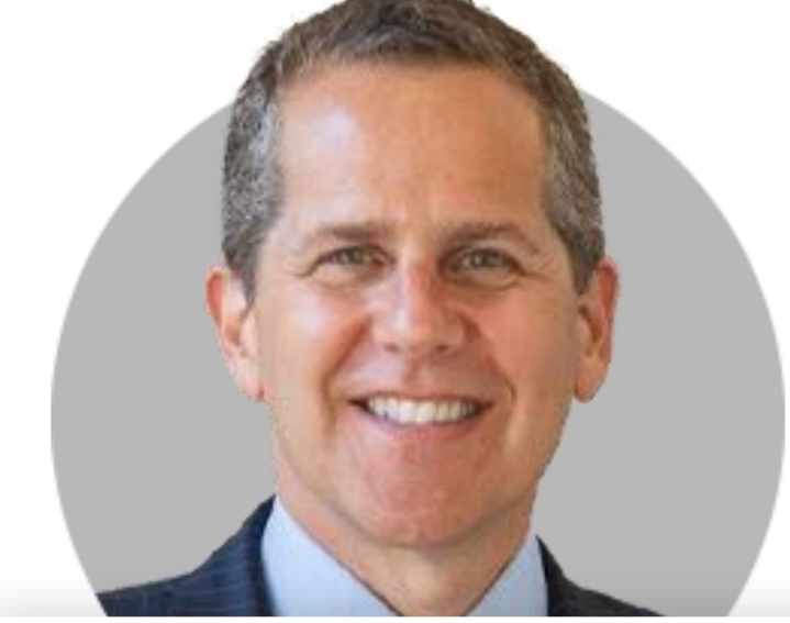
마이클 바 부의장

(4/21) 고용시장 강세지만 냉각 조짐 보여. 지속적인 경제 강세와 느린 디스인플레이션은 연준이 더 많은 일을 하도록 압박. 3월 PCE 4%대로 완화 예상