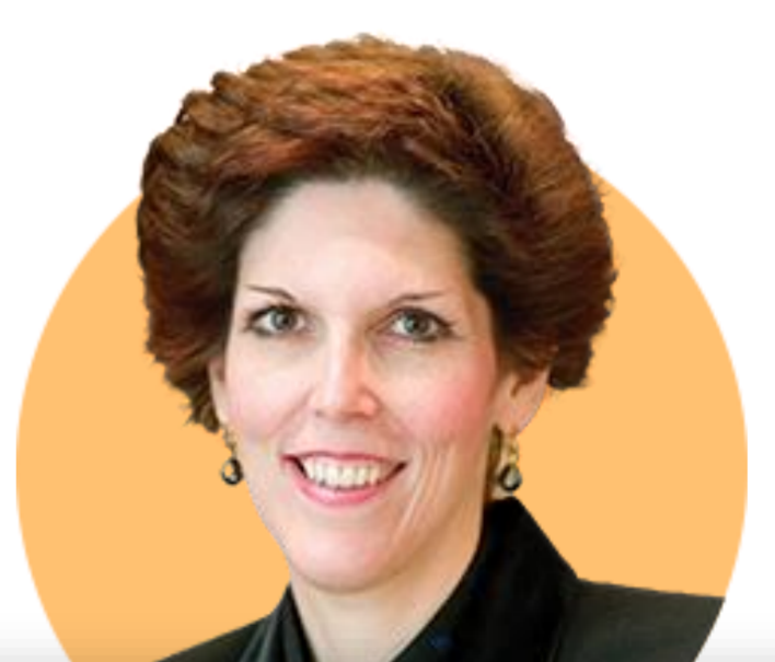
로레타 메스터 ★ 클리블랜드

(8/2) 오는 8월 21일부터 10년 동안의 임기 시작. 그는 FDIC 경력을 포함해 40년 이상 은행 및 규제 관련 경험 보유. 오마하 뮤추얼 은행 설립 및 CEO 역임