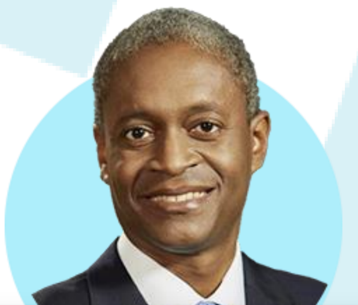
라파엘 보스틱 ★ 애틀랜타

(8/15) 인플레이션이 2%로 내려가고 있다는 설득력 있는 증거 보고 싶어. 금리 인상이 끝났다고 말할 준비 되지 않아. 금리인하와 거리 멀어. 미국 경제 회복력에 놀라