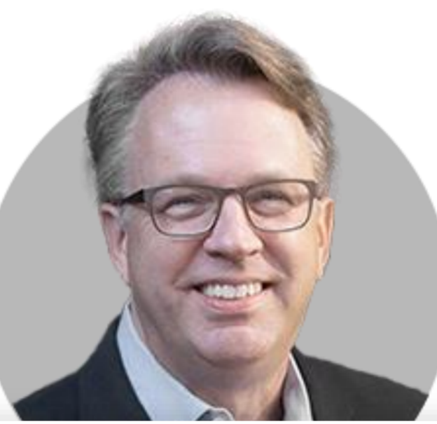
존 윌리엄스 뉴욕

(7/6) 인플레이션 충분히 빨리 식을지 매우 우려. 노동시장이 갑자기 악화될 조짐 보이지 않아. 목표 달성 위해서는 더 제한적인 정책이 필요