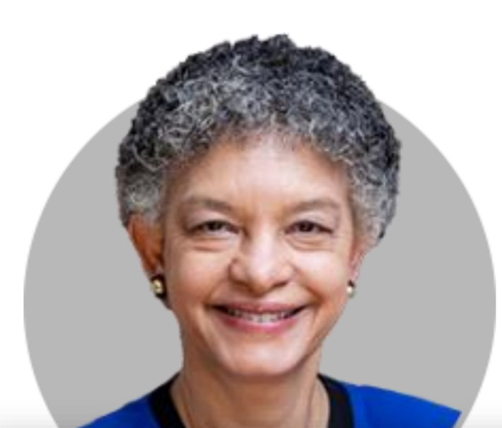
수잔 콜린스 보스턴

(8/10) 인플레이션 경로 완전히 하향되기를 원해. 우리가 지켜볼 부분은 핵심 서비스 인플레이션으로 팬데믹 이전 수준으로 되돌아가는 것을 볼 필요 있어