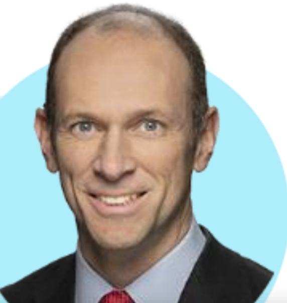
오스탄 굴스비 시카고

(8/4) 고용시장 약간 식었지만 여전히 강해. 우리는 얼마나 오랫동안 금리를 유지할 것인지에 대해 생각해야. 고용시장 균형과 연락처 할 수 있기를 바래