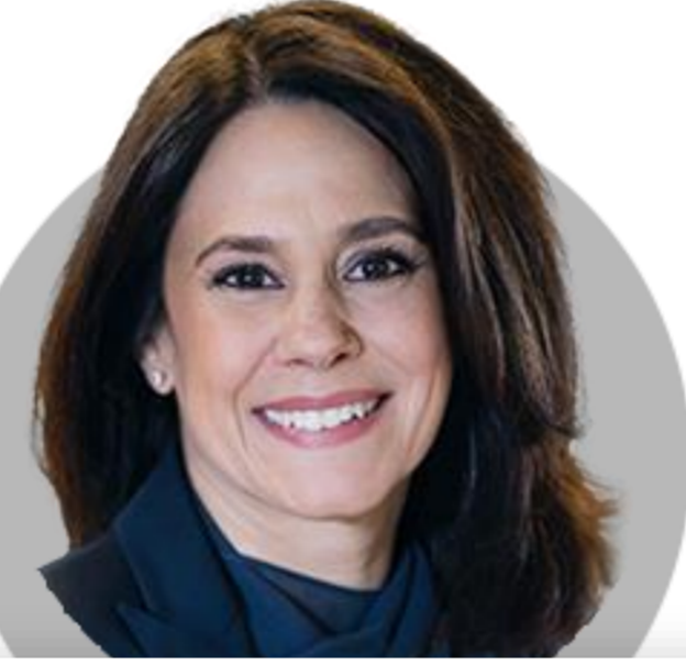
로리 K. 로건 댈러스

(8/24) 인플레이션 억제를 위한 충분한 조치 취해. 그러나 잠시 동안 높은 금리를 유지하는 걸 선호. 경기가 둔화할 조짐을 보인다면 실업률 4% 웃돌 것