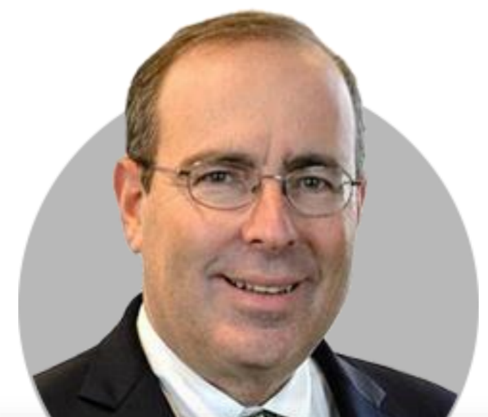
토마스 바킨 ★ 리치몬드

(8/24) 한 가지 분명한 것은 금리가 한동안 높은 수준을 유지하거나 혹은 제약적일 필요가 있을 것. 조만간 (금리가) 떨어질 것으로 기대해서는 안돼