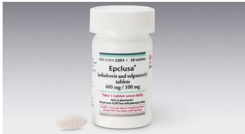
그림 2. 길리어드의 엠플루사