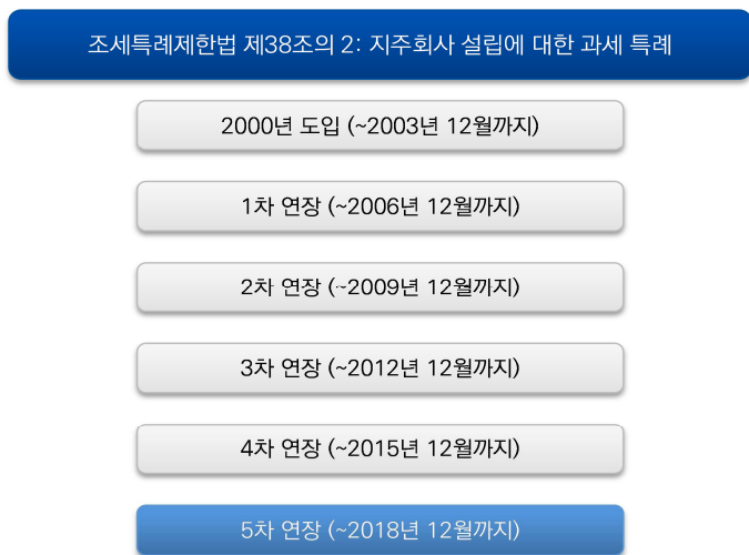
그림 3. 지주회사 설립에 대한 과세 특례 연장 내역

즉 조세특례제한법의 취지는 지주회사가 출자 법인에 대한 지분율을 높여 공정거래법상 자회사 지분율에 대한 기준 충족(상장 20%, 비상장 40% 이상)을 시키려는 현물출자에 대해 지원하기 위한 것으로 이미 자회사 지분율 요건을 충족하고 있으면 현물출자에 따른 과세이연을 받을 수 없음.