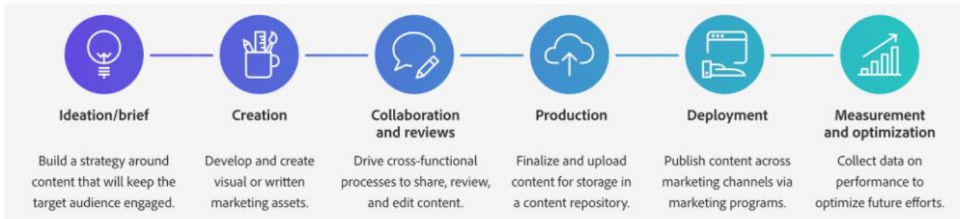
그림 3. GenStudio는 Content Supply Chain으로 분류되어 출시 - 여러 사람이 함께 콘텐츠를 제작하는 과정을 돕는 플랫폼