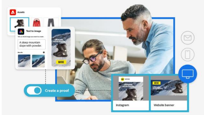
그림 2. 어도비의 GenStudio

9월 19일에는 GenStudio를 새롭게 발표했다. 이는 콘텐츠 아이디어 구상, 제작, 생산 및 활성화를 위한 최고의 기능을 결합한 플랫폼 형태의 콘텐츠 공급망 솔루션이며, 포토샵 등 Creative Cloud 제품들과 마케팅/광고를 위한 Experience Cloud 플랫폼이 모두 통합되어 생성형AI 기능들을 기반으로 콘텐츠를 제작하도록 돕는 역할을 한다.