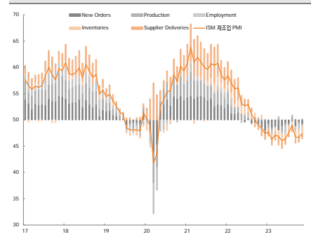
그림 1. 전월 대비 개선된 ISM 제조업 PMI