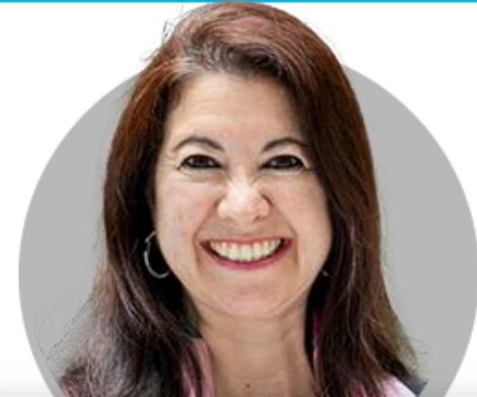
아드리아나 쿠글러 이사

(9/7) 임기는 2026년 1월 31일 까지. 세계은행과 노동부에서 미국 수석 경제학자를 지낸. 현재 조지타운 대학교에서 공공정책 및 경제학교수로 재직 중