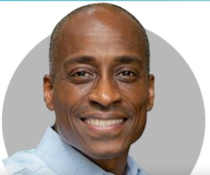
필립 제퍼슨 부의장

(11/16) 지속적인 디스인플레이션과 강력한 노동시장으로 '연착륙'이 가능하다고 믿지만 그것이 보장되지는 않아. 양면의 위험 있기 때문에 '균형'이 중요