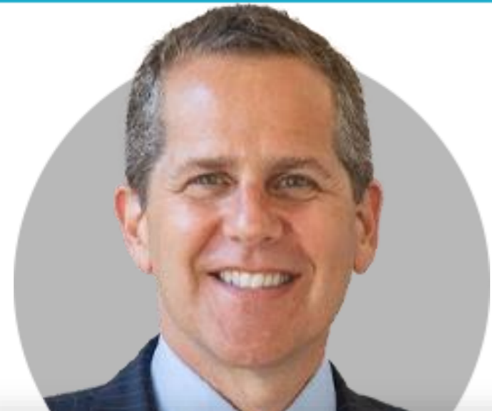
마이클 바 부의장

(9/7) 임기는 2026년 1월 31일 까지. 세계은행과 노동부에서 미국 수석 경제학자를 지낸. 현재 조지타운 대학교에서 공공정책 및 경제학교수로 재직 중