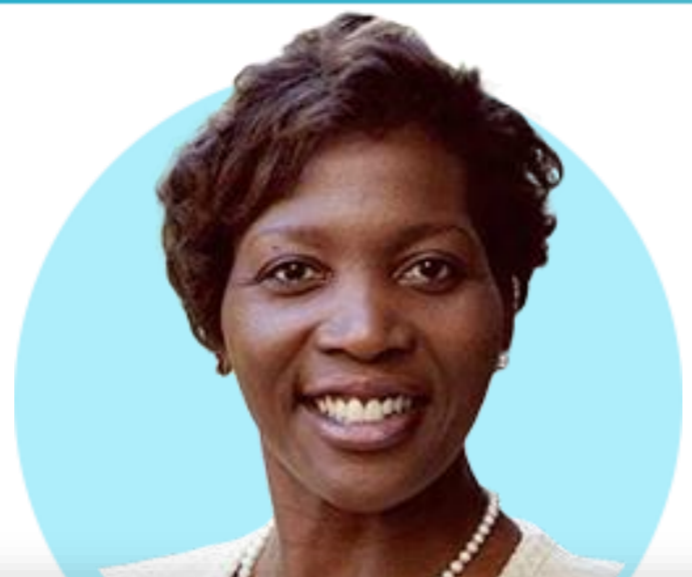
리사 쿡 이사

(1/9) 은행 자본 규제인 '바젤III' 주요 부분에 대한 조정 가능성을 신중하게 고려 중. 지난 해 3월 은행 위기 동안 시행된 대출프로그램(BTFP) 연장 가능성 낮아.