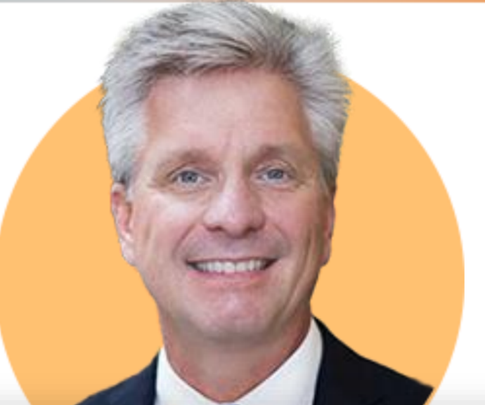
크리스토퍼 월러 이사

(1/31) 3월 금리 인하 생각하지 않아. 그러나 올해 어느 시점에는 시작될 가능성 높아. 2% 목표 인플레이션으로 향하고 있다는 더 큰 확신과 증거가 필요