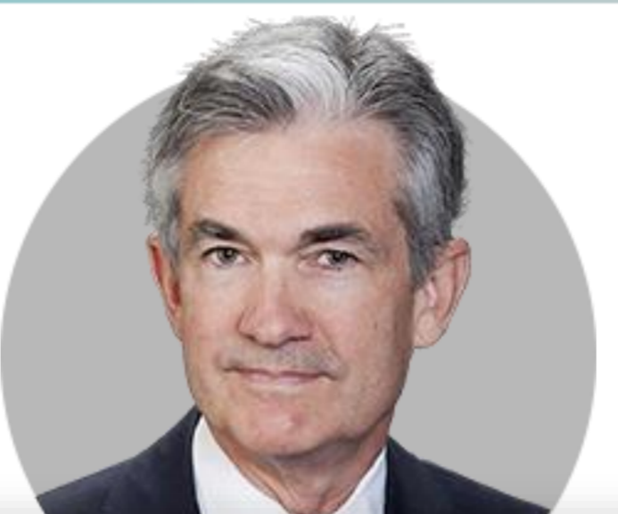
제롬 파월 의장

(11/14) 높은 인플레이션이 얼마나 오랫동안 지속될지 확실하지 않은 경우, 통화정책 입안자들은 인플레이션 기대치 유지를 위해 더 강력한 조치 취할 수도