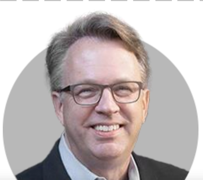
존 윌리엄스 뉴욕

(1/11) 12월 CPI는 예상했던 것과 비슷. 인플레이션이 2% 궤도에 오르면 금리를 낮출 수 있어. 인플레이션이 안정되고 있다는 확신이 필요.