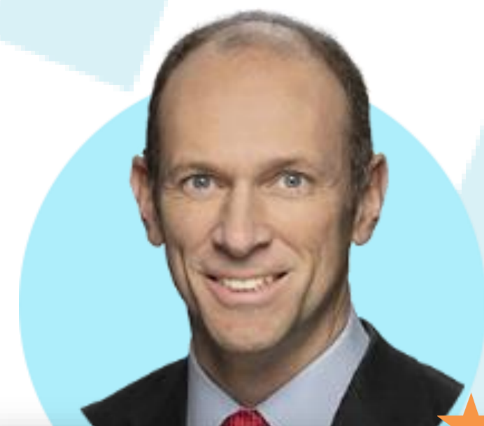
오스탄 굴스비 시카고

(1/19) 중앙은행 관계자의 말보다 데이터가 말하는 내용에 초점을 맞춰야. 상품, 서비스 인플레이션 많은 진전 보여. 주택은 더 많은 진전이 필요.