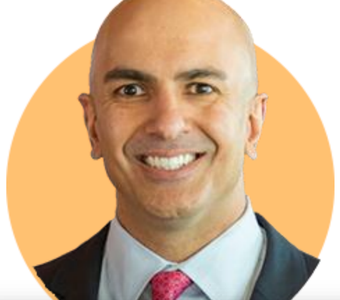
닐 카시카리 미니애폴리스

(8/2) 오는 8월 21일부터 10년 동안의 임기 시작. 그는 FDIC 경력을 포함해 40년 이상 은행 및 규제 관련 경험 보유. 오마하 뮤추얼 은행 설립 및 CEO 역임