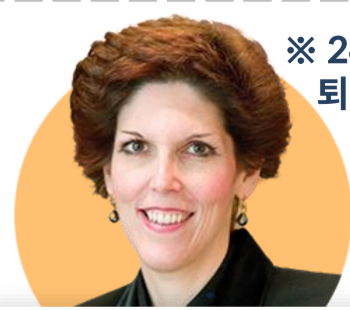
로레타 메스터 클리블랜드

(1/10) 우리의 목표 달성을 위해서는 한동안 제한적인 정책 기조를 유지할 필요 있어. 은행의 유동성 수준이 양적긴축(QT) 속도를 둔화해야 한다는 신호 아냐.