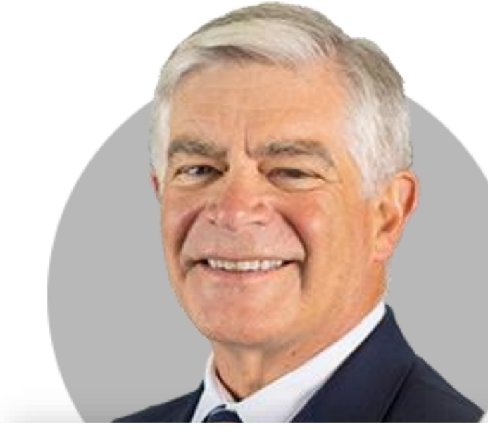
패트릭 하커 필라델피아

(1/19) 중앙은행 관계자의 말보다 데이터가 말하는 내용에 초점을 맞춰야. 상품, 서비스 인플레이션 많은 진전 보여. 주택은 더 많은 진전이 필요.