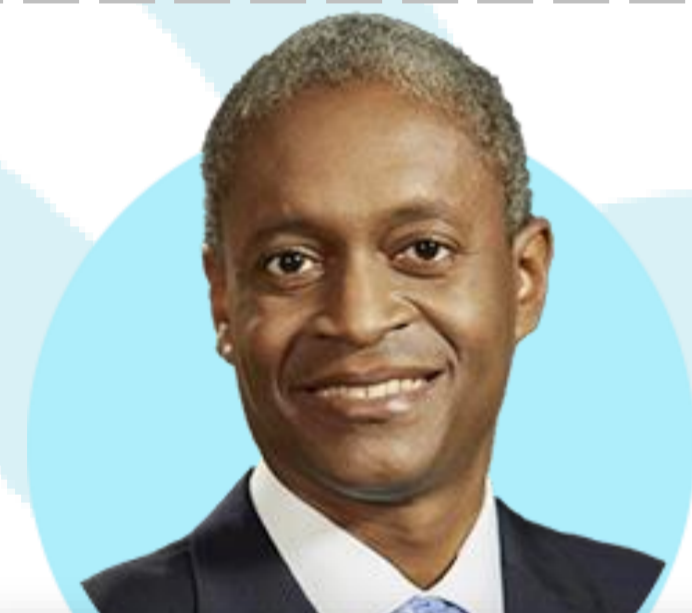
라파엘 보스틱 애틀랜타

(1/18) 인플레이션 예상보다 빠르게 둔화한다는 확실한 증거 있다면 7월 이전 금리인하 시작할 가능성 있어. 기본은 3분기부터 연내 50bp 인하.