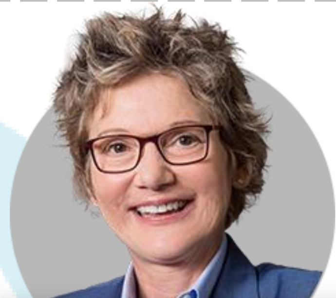
메리 델리 샌프란시스코

(1/18) 인플레이션 예상보다 빠르게 둔화한다는 확실한 증거 있다면 7월 이전 금리인하 시작할 가능성 있어. 기본은 3분기부터 연내 50bp 인하.