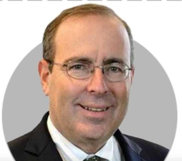
토마스 바킨 리치몬드

(1/19) 정책금리 완화를 위해서는 더 많은 증거와 인내심 필요. 조기에 금리를 인하할 것이라 생각은 시기상조. 연체율 상승은 경기침체의 초기징후.