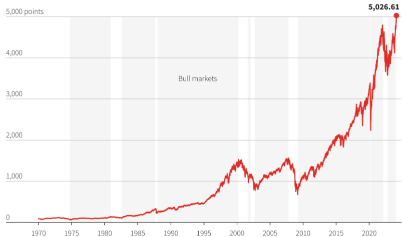
그림 1. 2022년 10월 12일 저점 이후 20% 넘게 상승한 S&P 500 지수