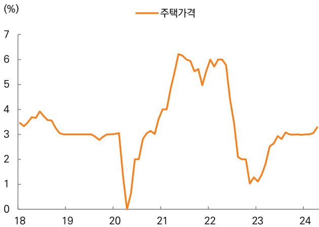
그림 2. 미국 주택 가격 상승률: 2022년 7월 이후 최고