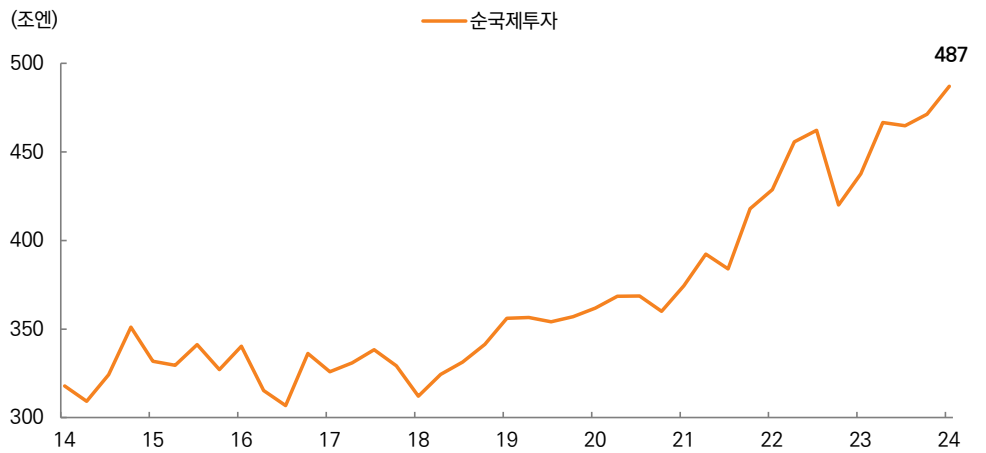
그림 3. 일본 순 국제 투자 규모

자료: CLSA, 블룸버그, 미래에셋증권 디지털리서치팀 / 주: 2024년 기준