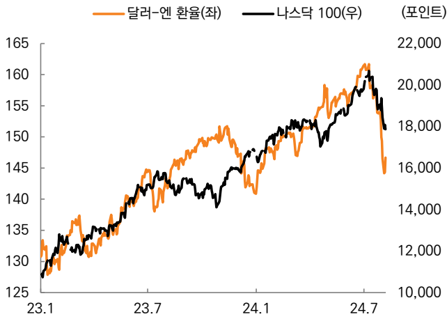
그림 1. 달러/엔 환율과 나스닥100 지수 추이