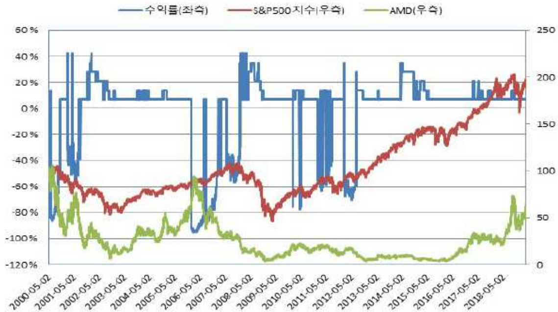
미래에셋증권 제33050회 (수익률 모의실험)